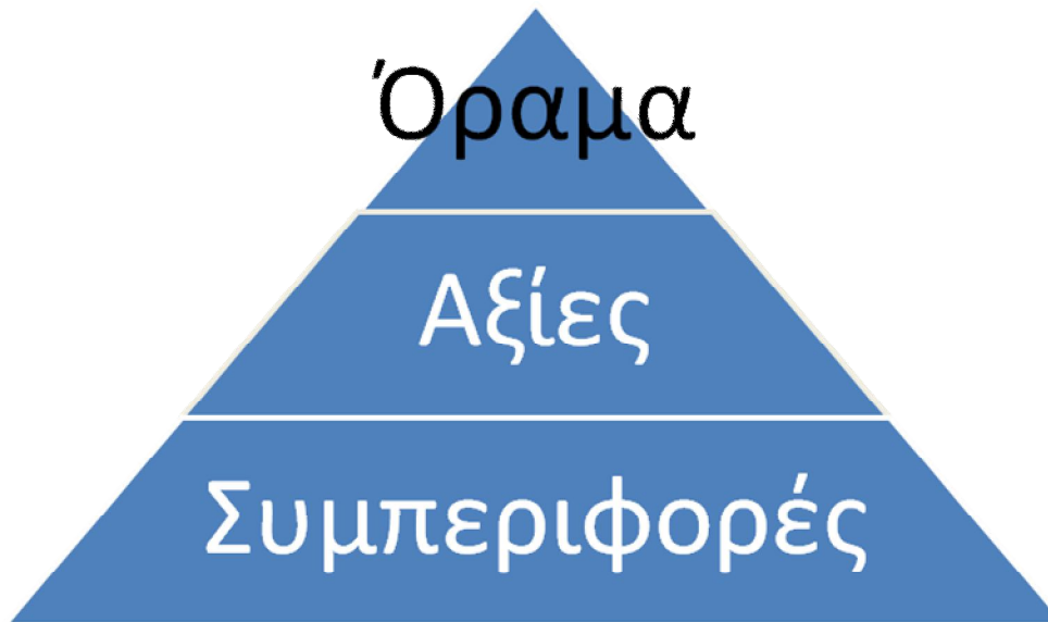
Σχ. 2 Σκέλος ανθρώπινων συμπεριφορών