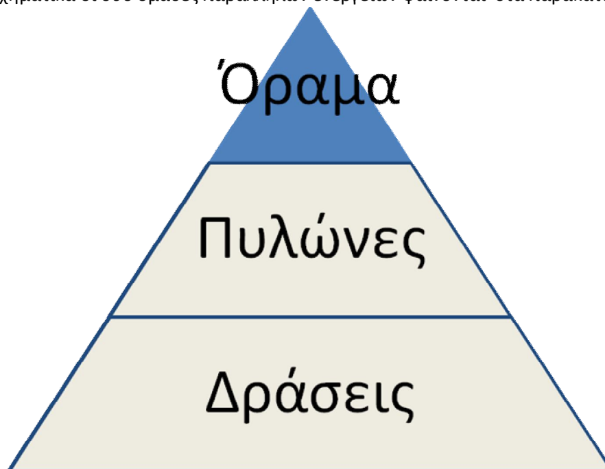
Σχ. 1 Επιχειρησιακό σκέλος