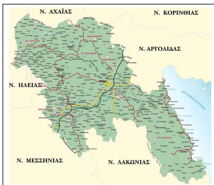
Χάρτης Νομού Αρκαδίας

Στην Πελοπόννησο, κατά τον Ηρόδοτο, υπήρχαν επτά έθνη, δύο από τα οποία ήταν των Αρκάδων και των Κυνουριέων. Κατά την αρχαιότητα η Κυνουρία 3 περιλάμβανε όλη την ανατολική προέκταση της οροσειράς του Πάρνωνα και βόρεια έφθανε μέχρι τη θάλασσα. Η γεωγραφική της θέση την καθιστούσε πολύτιμη στρατηγική περιοχή μεταξύ Άργους και Σπάρτης, και γι' αυτό την διεκδικούσαν τόσο οι Σπαρτιάτες όσο και οι Αργείοι. Ακόμα, κατά τον Ηρόδοτο, οι Κυνούριοι ήταν Ίωνες προερχόμενοι από το Άργος, αλλά εκδωρίστηκαν όταν το Άργος ήταν μεγάλο προδωρικό κέντρο. Τέλος, το γεγονός ότι και οι δυο λαοί, Αρκάδες και Κυνούριοι ήταν αυτόχθονες αλλά και γείτονες δεν αποκλείει να ήταν κάποτε ένας λαός.